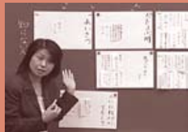
■監修・解説：大熊 徹(東京学芸大学教授)

国語の授業を効果的に展開するためには、例えば、「徹底した教材研究」「学習者理解」「学習者主体の単元構成」さらには「効果的な発問・板書」など様々な方法が考えられます。今回は、小学校2年生、4年生、5年生の説明文を用いた授業を取り上げ、「効果的な板書」について紹介しています。子どもの発達段階に即して確かな言語力を育てることのできる板書、また、具体的な資料や絵画などを駆使して興味・関心を持たせながら、確かな理解に導くことのできる板書の工夫をご覧ください。