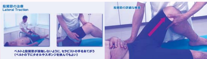
股関節の治療 Lateral Traction ベルトと股関節が接触しないように、セラピストの手をあてて(ベルトの下にタオルやスポンジを挟んでもよい)