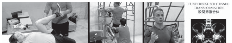
FUNCTIONAL SOFT TISSUE TRANSFORMATION 股関節複合体