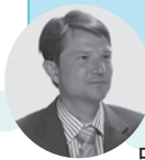
ローレント・ガロシ